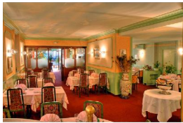
Le Morvan 28 rue du Petit Mouësse 58000 NEVERS Tél : 03 86 61 14 16