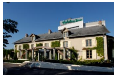
Alliance Hotel Ferme du Bardonnay 58470 MAGNY COURS Tél : 03 86 21 22 33