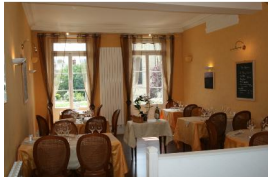
O puits 21 rue Mirangron 58000 NEVERS Tél : 03 86 59 28 88