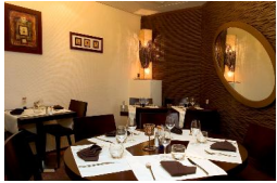
Le Karousel hotel Kyriad 35 bd Victor Hugo 58000 NEVERS Tél : 03 86 71 95 95

Merci de réserver par téléphone quelques jours avant votre venue afin que le restaurateur puisse vous assurer le meilleur accueil