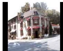
La Grenouille 1 Route d'Apremont 18150 CUFFY Tél : 02 48 77 50 50