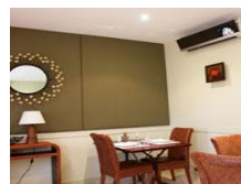
Le Bengy 25 route de Paris 58640 VARENNES VAUZELLES Tél : 03 86 38 02 84