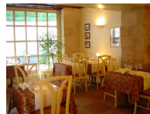
La Cour St Etienne 33 rue St Etienne 58000 NEVERS Tél : 03 86 36 74 57