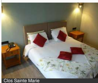
Clos Sainte Marie

25, rue du Petit Mouësse 58000 NEVERS Tél : 03 86 71 94 50 clos-sainte-marie.fr