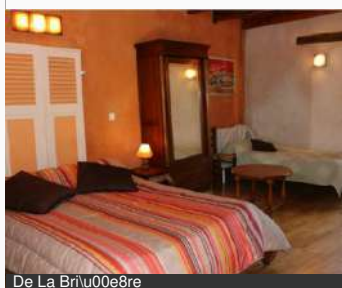
De La Bre

Les Indrins 58180 MARZY Tél : 03 86 59 22 71 Tél : 06 98 21 45 68 lesindrins.com