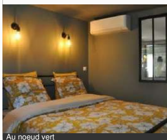
Au noeud vert

49 Rue de Nievre 58000 NEVERS Tél : 07 66 01 57 21 aunoeverd.fr