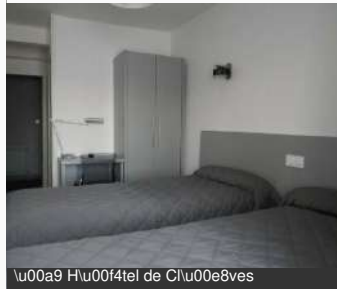
u00a9 H\u00f4tel de Cl\u00e8ves

8 Rue Saint-Didier 58000 NEVERS Tél : 03 86 61 15 87 hoteldecleves.fr