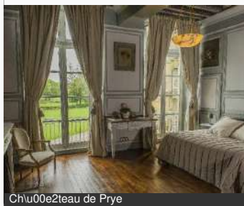
Château de Prye

Château de Prye 58160 LA FERMETE Tél : 03 86 58 42 64 chateaudeprye.com