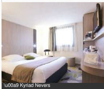
\u00a9 Kyriad Nevers

35 Bd Victor Hugo 58000 NEVERS Tél : 03 86 71 95 95 kyriad-nevers-centre.fr