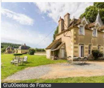
Glu00eetes de France

Château de Prye 58160 LA FERMETE Tél : 03 86 58 42 64 chateaudeprye.com