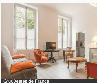
Glu00eetes de France

13 rue Gambetta 58000 NEVERS Tél : 02 48 74 18 83