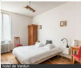
hotel de Verdun

4 Rue de Lourdes 58000 NEVERS Tél : 03 86 61 30 07 hoteldeverdun-nevers.fr