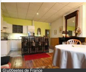
Glu00eetes de France

11 rue Gambetta 58000 NEVERS Tél : 02 48 74 18 83